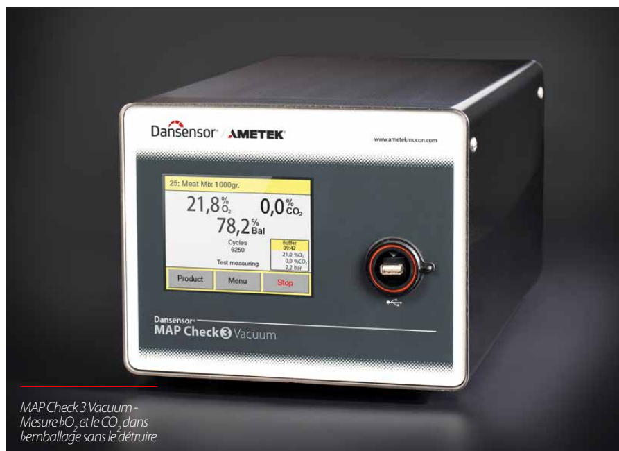
MAP Check 3 Vacuum - Mesure l'O 2 et le CO 2 dans l'emballage sans le détruire

UNE SOLUTION GAGNANT-GAGNANT POUR LES THERMOFORMEUSES ET LES OPERCULEUSES